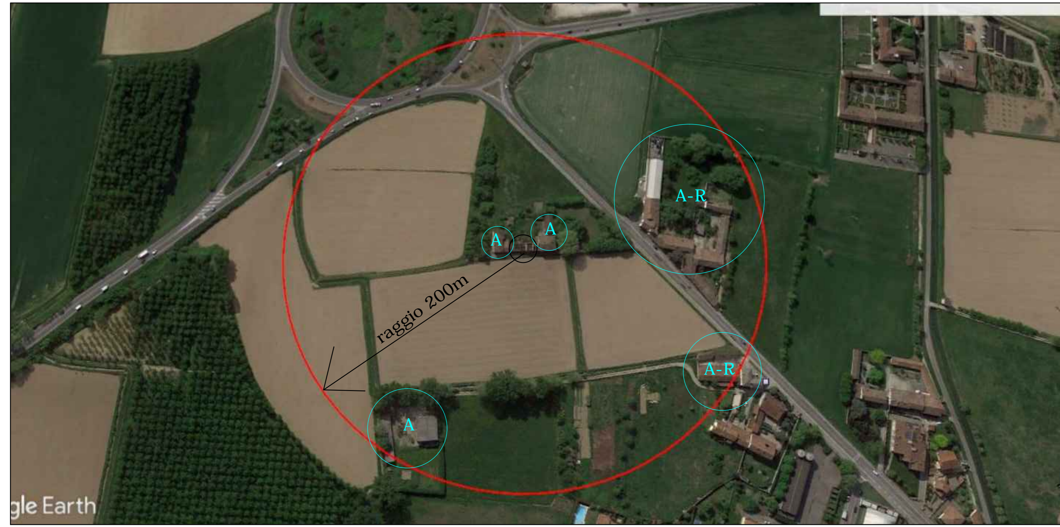
Estratto ortofoto dal satellite SCALA 1:2000