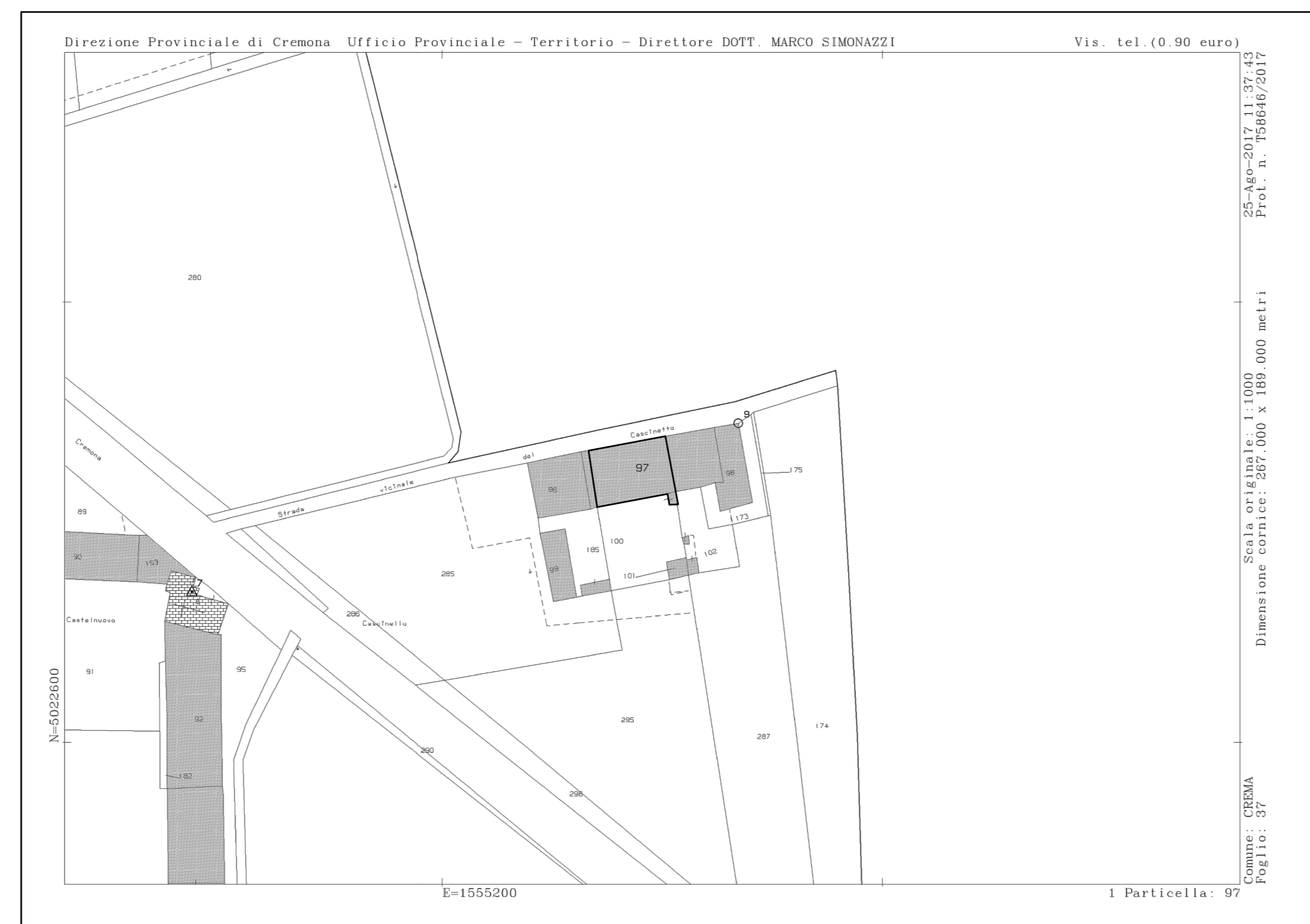
Estrato di mappa NCTR Foglio 37, mappali 97/parte - 100 - 101 SCALA 1:1000