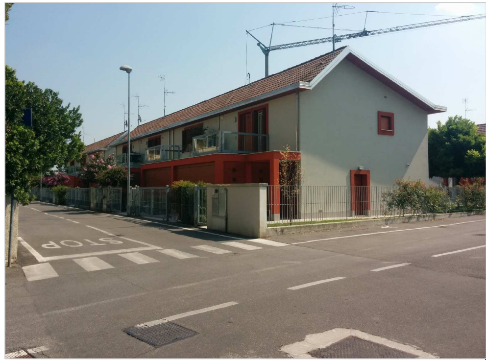
INGRESSO ALLA LOTTIZZAZIONE DA VIA CARDUCCI