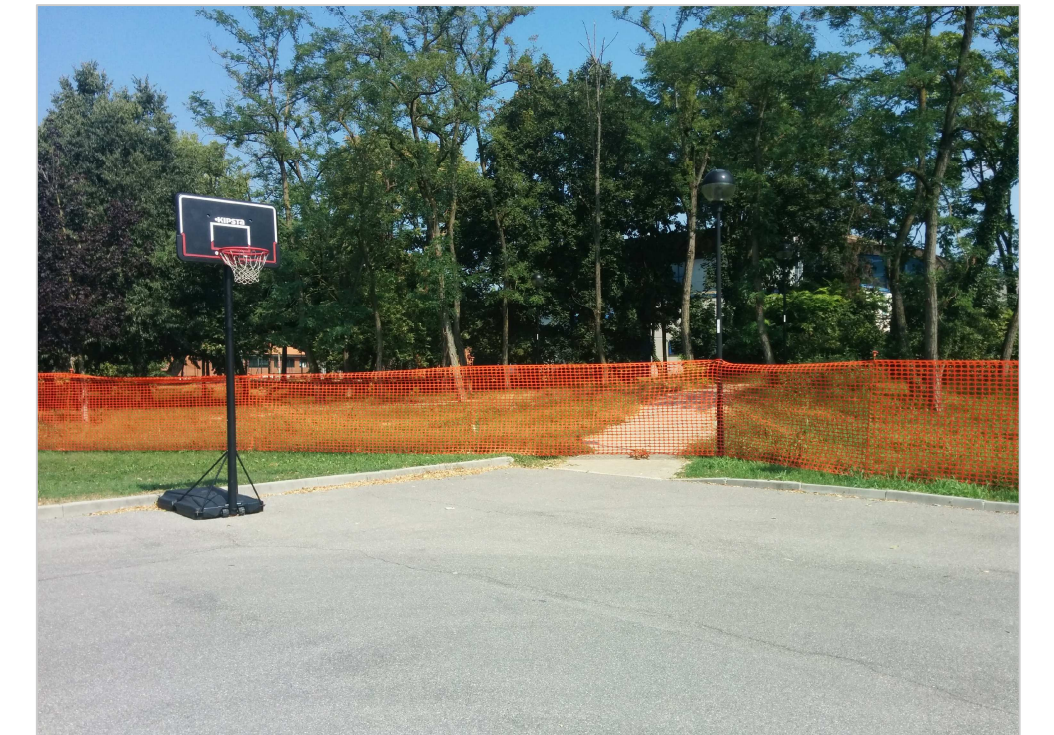
VISTA DEL PERCORSO CICLABILE ESISTENTE DA VIA CARDUCCI DI COLLEGAMENTO ALLA FUTURA CICLABILE