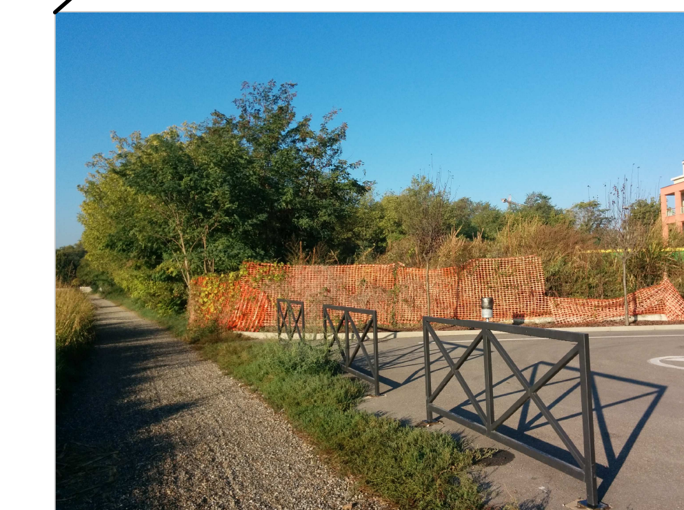
VISTA AREA IN CESSIONE DAL COMUNE AD IMMOBILIARE PARCO S.R.L.