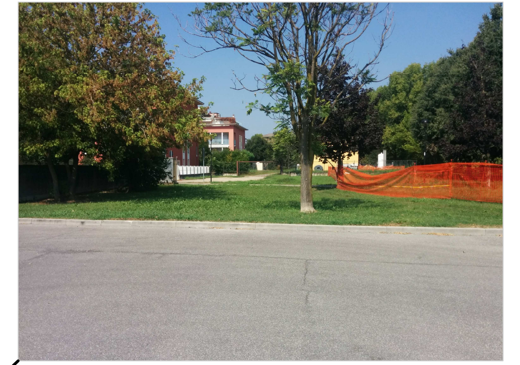
AREA DOVE VERRÀ REALIZZATO IL FUTURO COLLEGAMENTO STRADALE TRA IL PARCHEGGIO PUBBLICO E VIA MANENTI