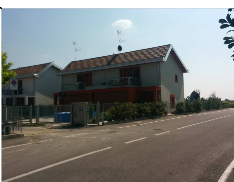
VISTA EDIFICI INTERNI ALLA LOTTIZZAZIONE