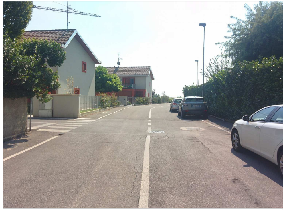
INGRESSO ALLA LOTTIZZAZIONE DA VIA CARDUCCI