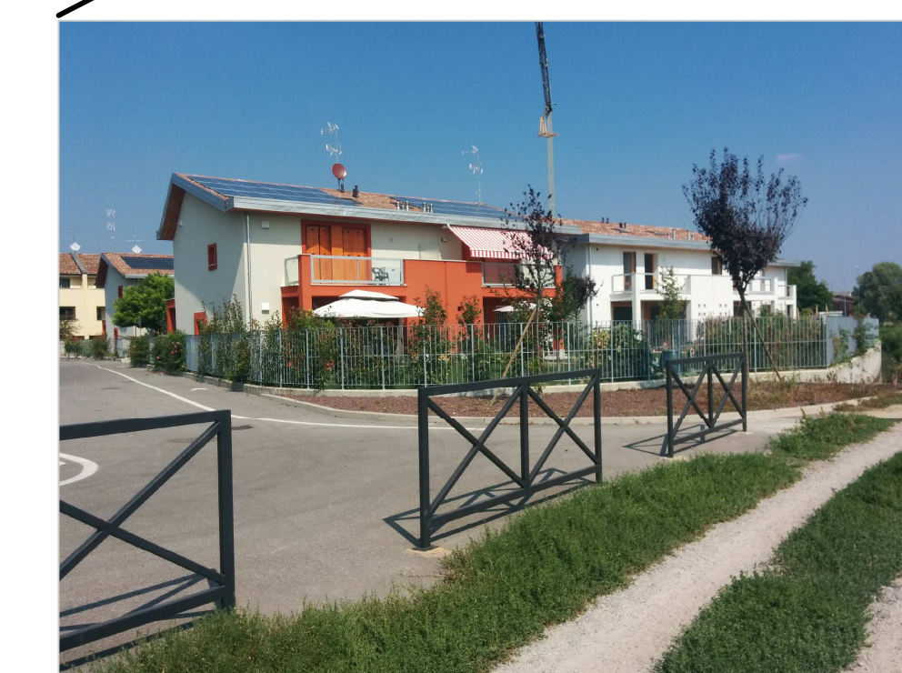
VISTA DALLA STRADA CAMPESTRE COMUNALE DEGLI EDIFICI ULTIMATI ED IN ULTIMAZIONE