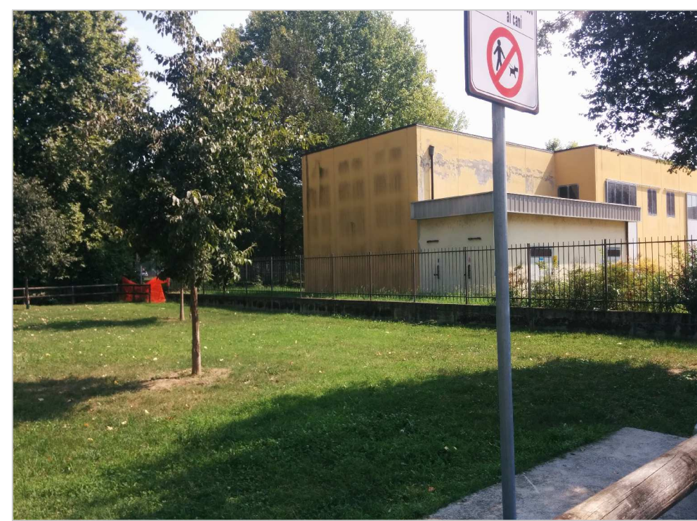
AREA DEL FUTURO PERCORSO CICLABILE E POZZO ACQUEDOTTO COMUNALE ESISTENTE