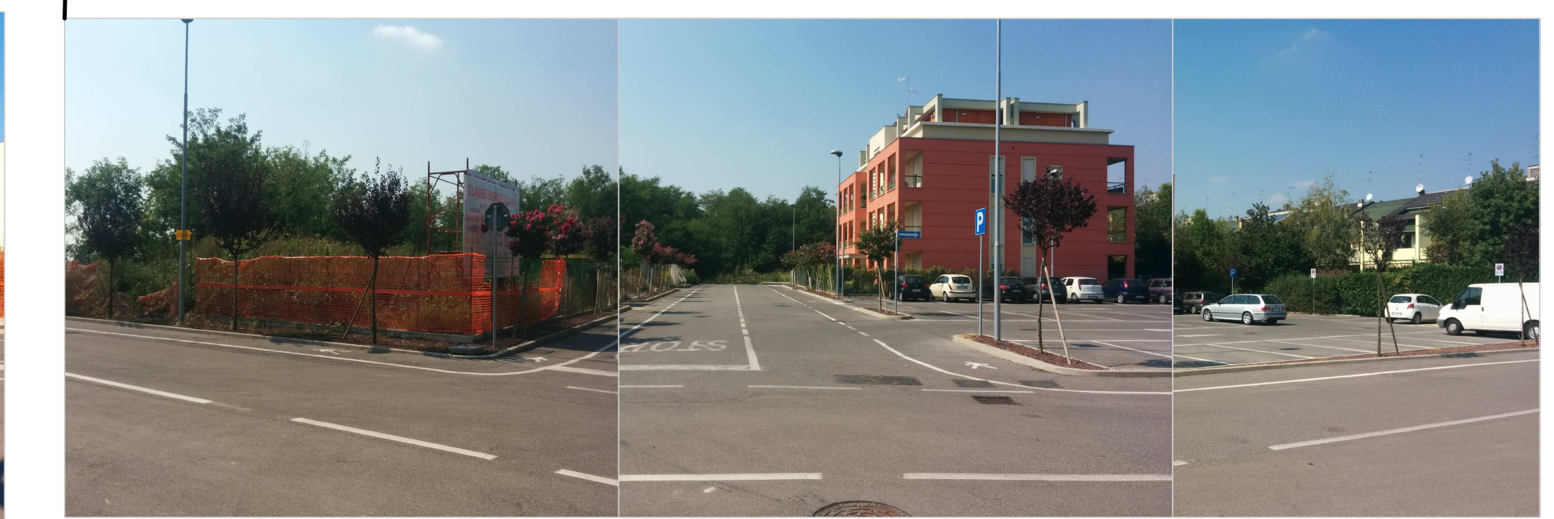
PARCHEGGIO PUBBLICO, PALAZZINA IN LATO SUD-EST E STRADA DI LOTTIZZAZIONE