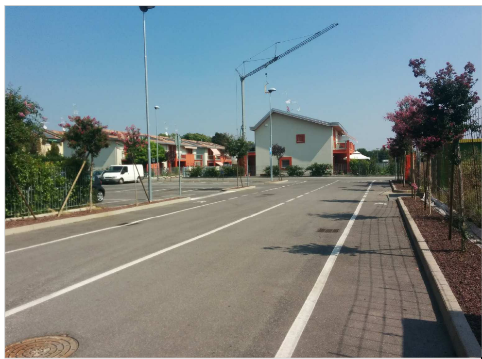
VISTA DEGLI EDIFICI ULTIMATI DALLA STRADA INTERNA ALLA LOTTIZZAZIONE