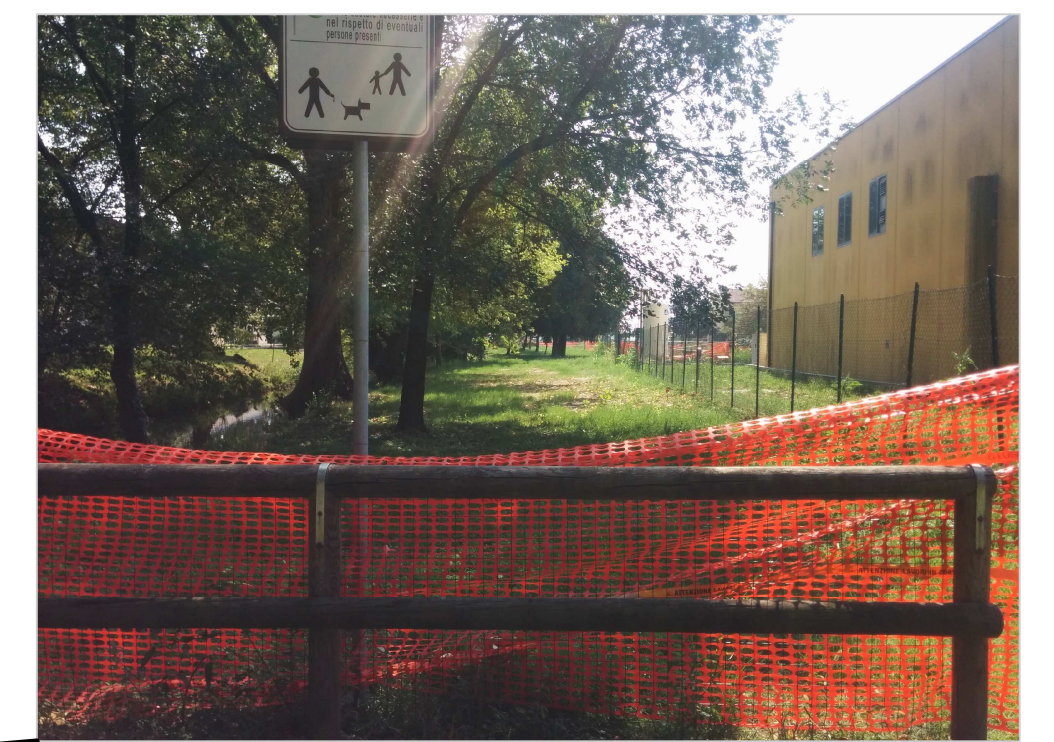
AREA DEL FUTURO PERCORSO CICLABILE TRA ACQUEDOTTO COMUNALE ESISTENTE E ROGGIA ALCHINA