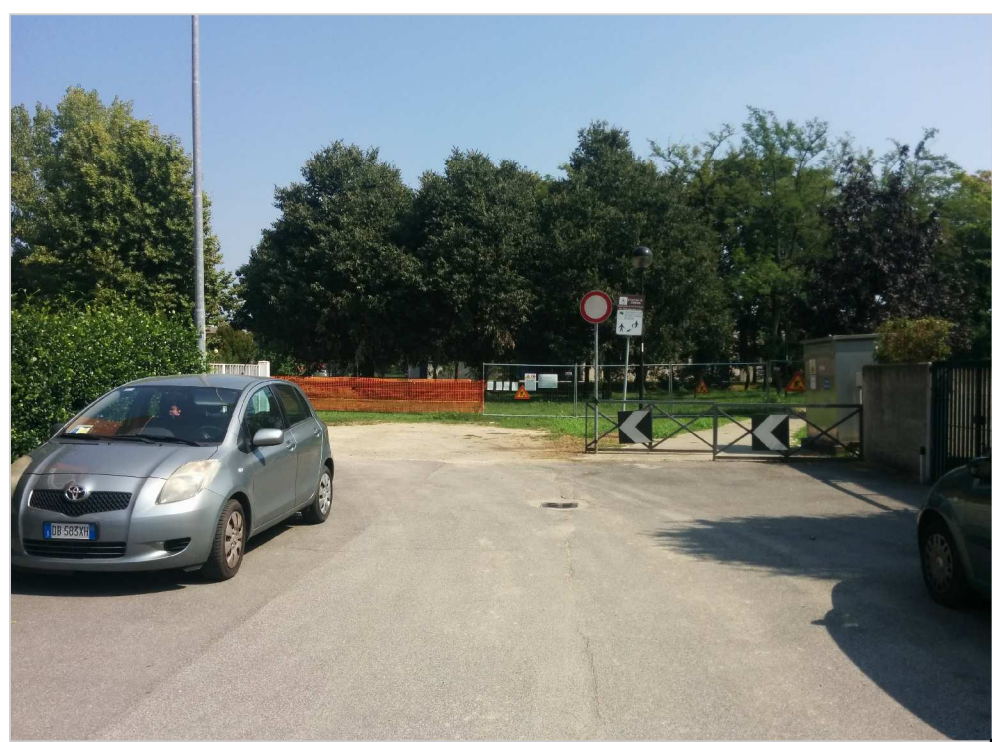
VISTA DEL FUTURO PUNTO DI COLLEGAMENTO STRADALE DA VIA MANENTI AL PARCHEGGIO PUBBLICO