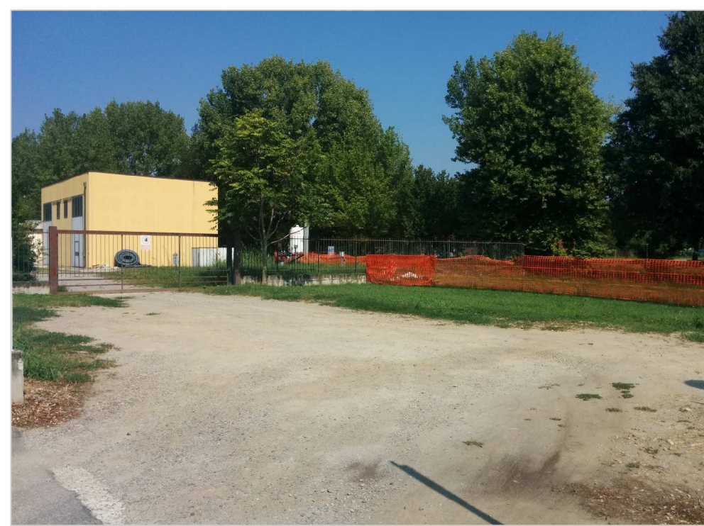
VISTA DEL POZZO ACQUEDOTTO COMUNALE ESISTENTE DA VIA MANENTI