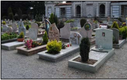
Campo di fosse distinte.