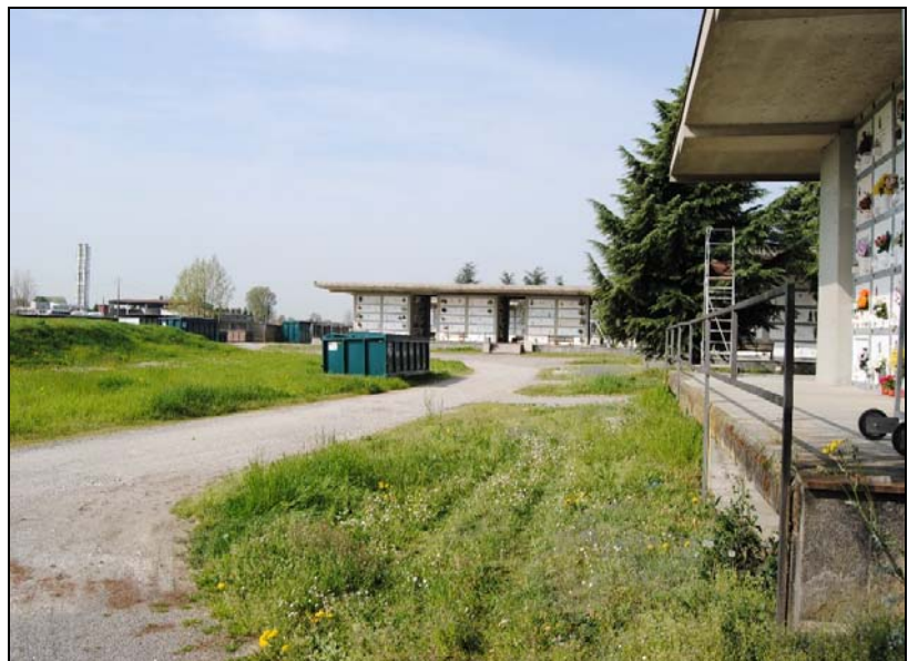
Zona posta a sud dei corpi A – B – C – D – E – F lasciata a prato incolto con i cassonetti per la raccolta rifiuti.