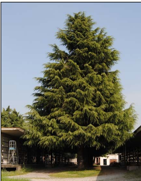
Cedro del libano ( Cedrus libani ).

Gli impianti elettrici presenti sono, soprattutto nelle strutture più vecchie ed in particolar modo nel Monumentale Sotterraneo, obsoleti e soggetti a guasti ricorrenti e necessiterebbero di una revisione ed eventualmente di un adeguamento dal punto di vista della rispondenza alle normative attuali.