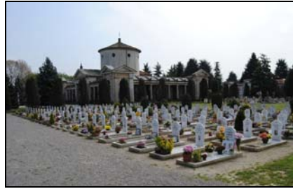
Campo di fosse comuni.