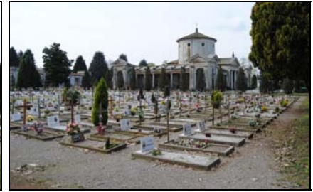
Campo di fosse di mineralizzazione

Le aree a verde vengono curate e mantenute in buono stato al pari dei viali. Rilevante è la presenza di un discreto numero di essenze arboree di elevato pregio: cedri del libano ( Cedrus libani ), cedri dell'Atlante o glauchi ( Cedrus atlantica ), magnolie grandiflora, cipressi ( Cupressus sempervirens ), lauro ceraso ( Laurus cerasus ). Segnaliamo però che gli alberi che nel tempo vengono abbattuti per motivazioni varie non vengono sostituiti con conseguente impoverimento del patrimonio arboreo.