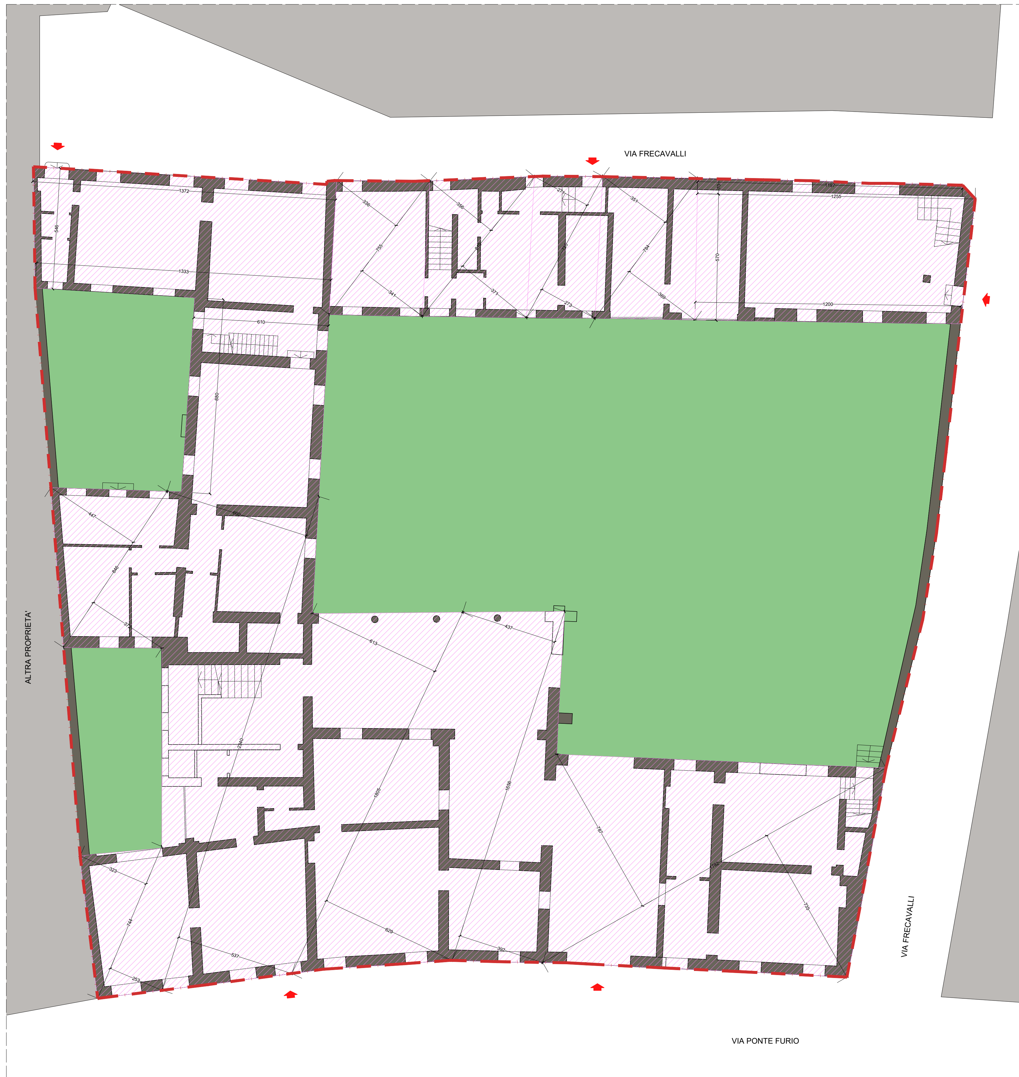
PIANTA PIANO TERRA STATO DI FATTO