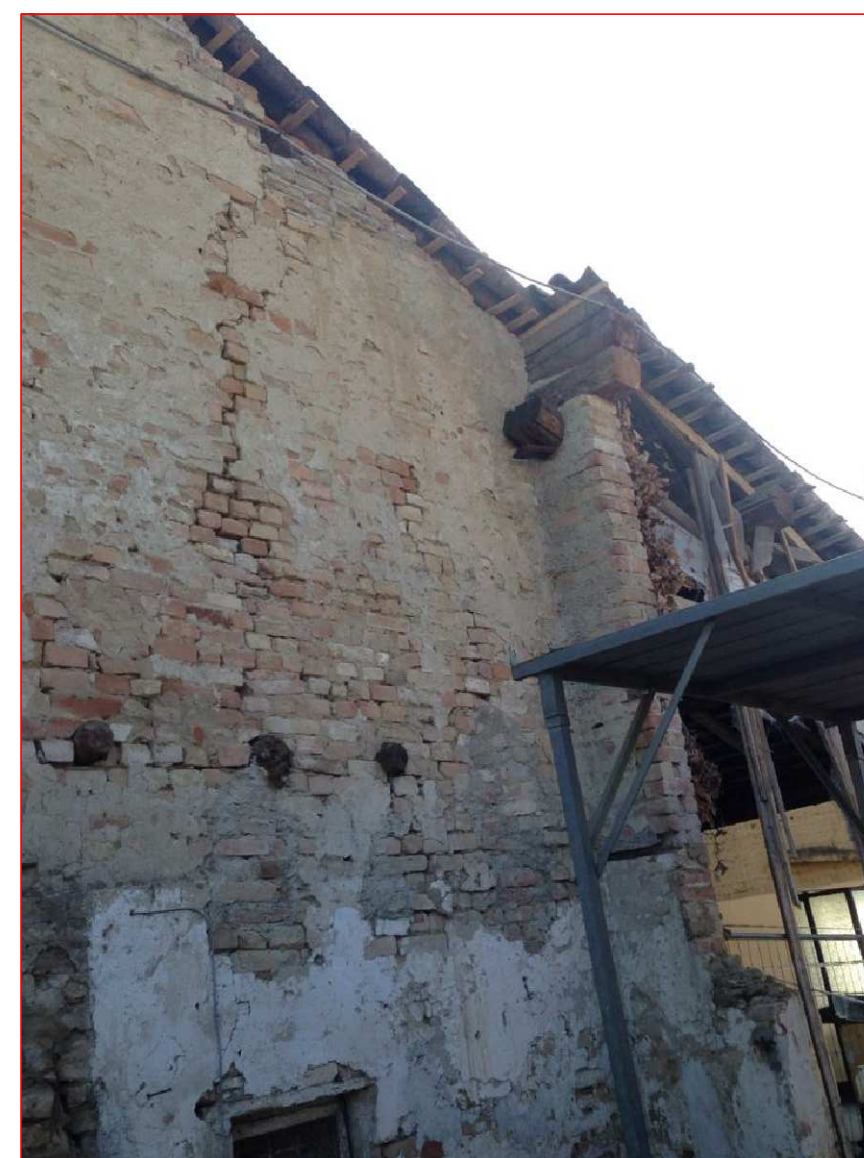
Vista OVEST lungo il confine con la proprietà Agosti