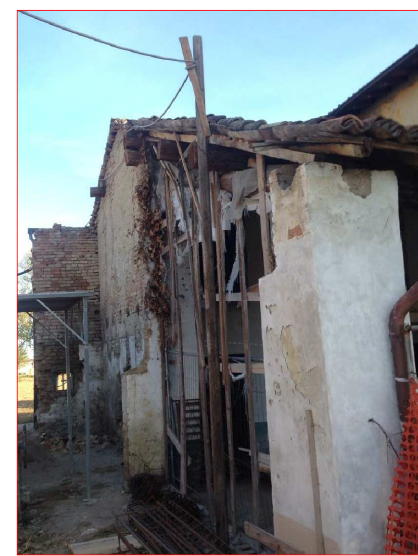
Vista NORD lungo il confine con la proprietà Agosti