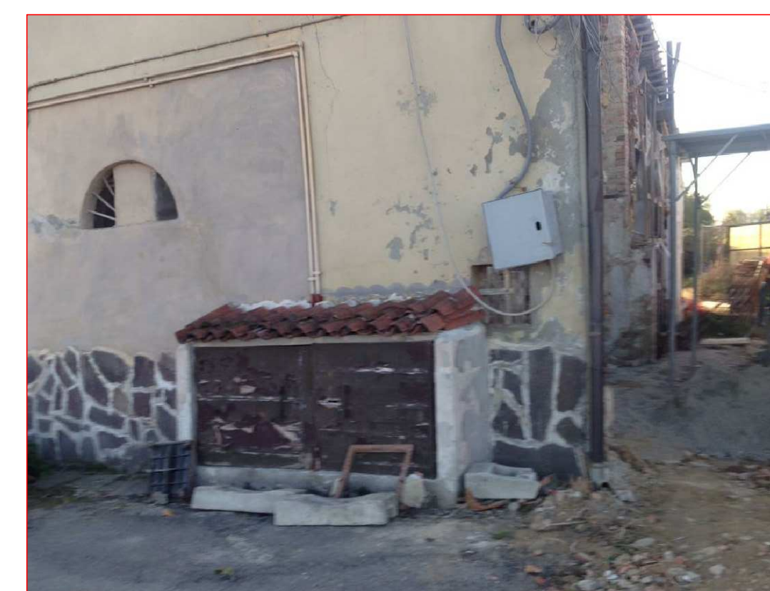
Vista NORD lungo il confine con la proprietà Agosti lungo strada vic. Cascinetto