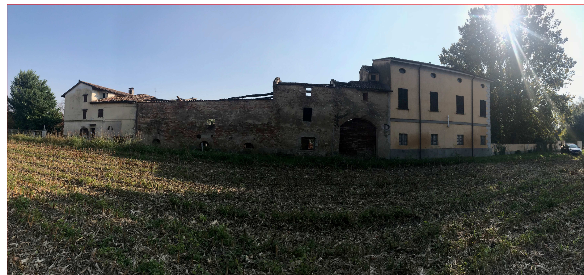
Panoramica d'insieme fronte NORD