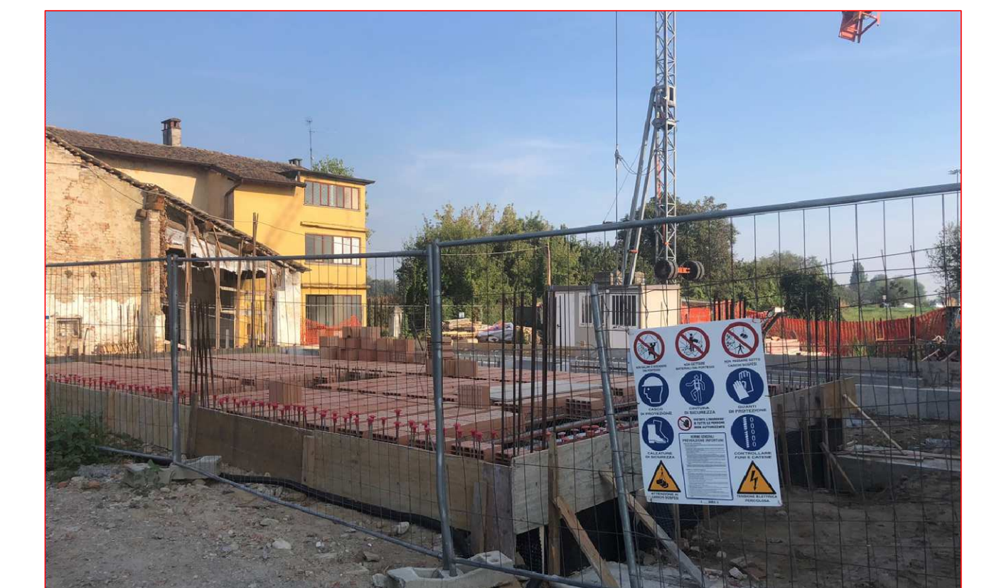
Attuale avanzamento dei lavori in seguito alla concessione edilizia