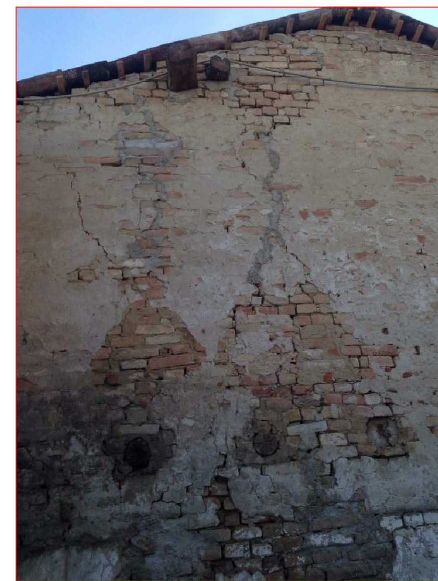
Vista NORD-OVEST lungo il confine con la proprietà Agosti