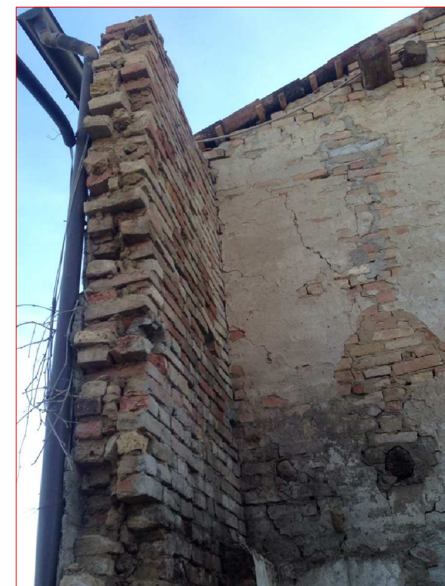
Vista NORD-OVEST lungo il confine con la proprietà Agosti