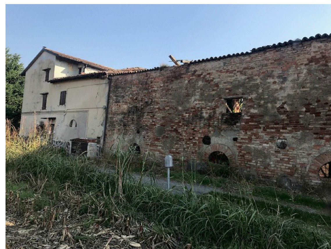
Vista NORD -EST lungo il confine con la proprietà Agosti