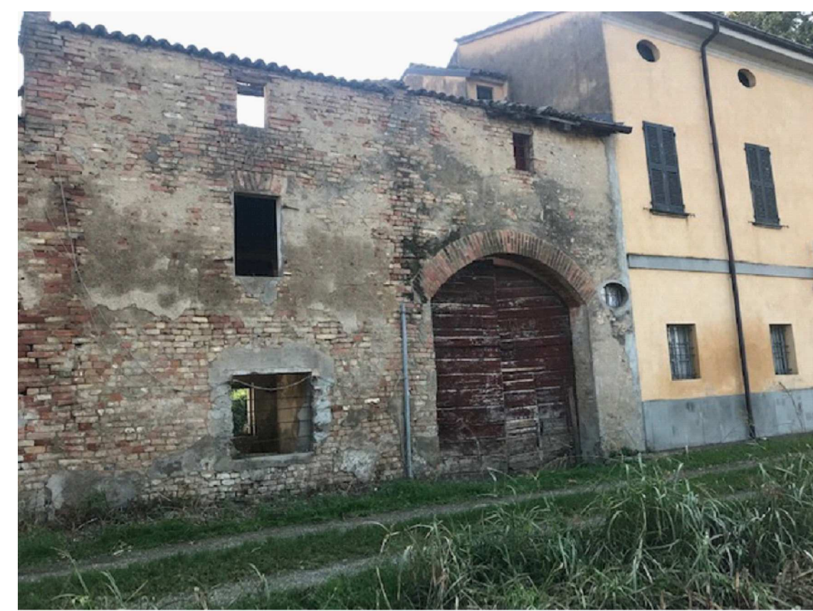
Vista NORD-OVEST lungo il confine con la proprietà Caporali