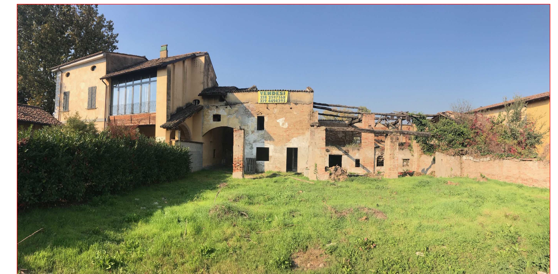
Panoramica d'insieme fronte SUD dalla corte interna