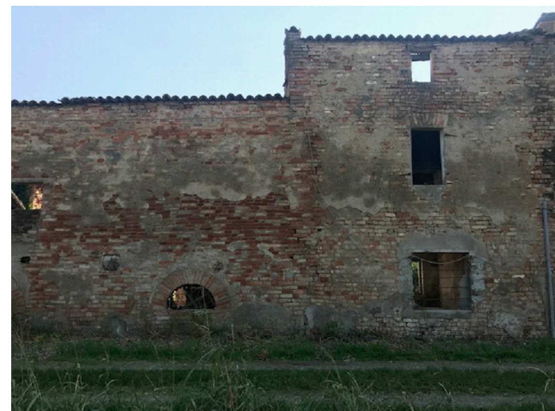
Vista NORD differenza livello esistente tra l'abitazione ed ex fienile