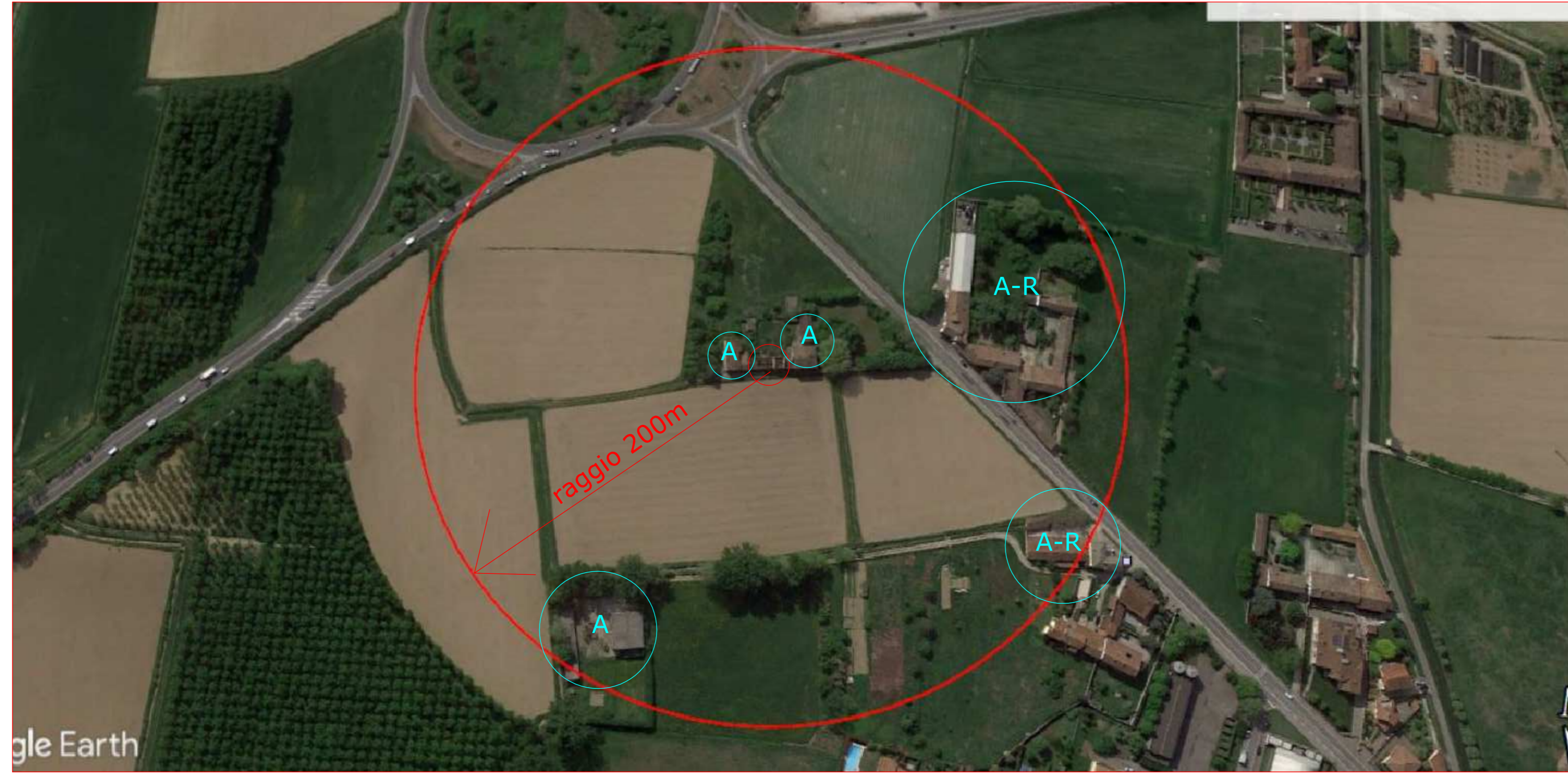
Estratto ortofoto dal satellite SCALA 1:2000