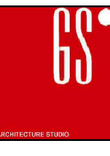
Tavola n. 07 Data: 23/12/2019 Aggiornamento: Note:

STUDIO DI ARCHITETTURA - SCARRI Dott. Arch. GIUSEPPE - 26013 Crema, via C. Urbino 52 tel. 0373/86084