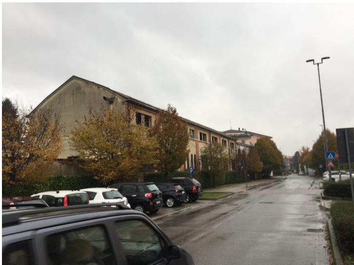
Vista da via Bambini del Mondo

Come già evidenziato in premessa, l'area ricompresa all'interno del comparto oggetto dell'odierna proposta progettuale è collocata in ambito già fortemente antropizzato e non risulta essere caratterizzata dalla presenza di particolari elementi di pregio paesistico – ambientale.