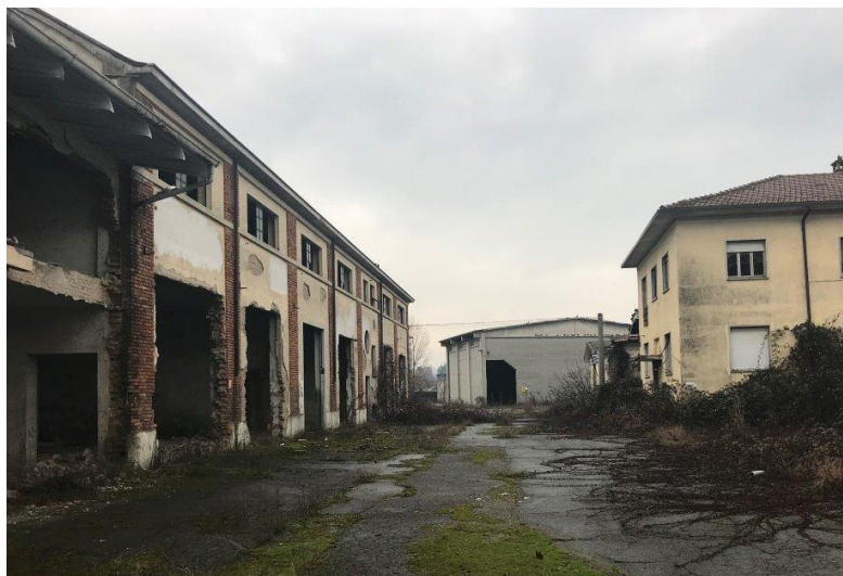
Vista area interna alla proprietà