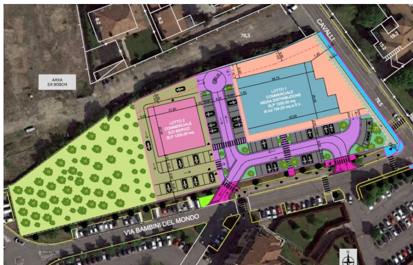
Planivolumetrico di progetto

Come precisato nella Relazione Tecnica illustrativa, allegata alla proposta di PA, l'attuazione dell'intervento edificatorio sarà caratterizzata da criteri di qualità architettonica, finalizzati ad assicurare l'obiettivo di ottenere una congrua qualificazione complessiva del nuovo insediamento, nonché le condizioni di massima relazione funzionale e figurativa con il contesto circostante. Oltre a ciò, saranno previsti, dal punto di vista impiantistico, diversi accorgimenti, volti a ridurre ulteriormente i potenziali impatti correlati all'intervento: in particolare, verrà garantito il rispetto di quanto disposto dalla DGR n. VIII/8745 del 22.12.2008, recante: "Determinazioni in merito alle disposizioni per l'efficienza energetica in edilizia e per la certificazione energetica degli edifici" .