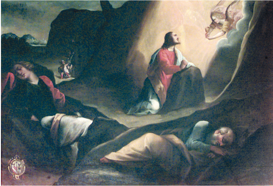
Fig. 1. Tomaso Pombioli, Gesù nell'orto del Getsemani , 1606, olio su tela, 125x185 cm, Leffe, San Rocco.

grafia fa pensare che possano essere state commissionate in funzione di pratiche devozionali dei disciplini 18 . La lettura stilistica ci permette di precisare che appartengono a due distinti maestri 19 e che vennero