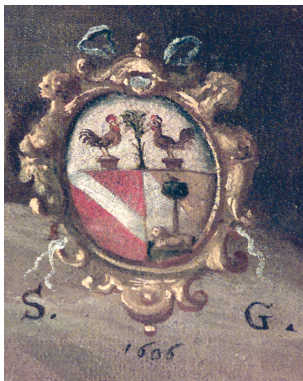
Fig. 4. Tomaso Pombioli, Gesù inchiodato alla croce , particolare dello stemma Galizioli con la data 1606.

zione delle commissioni. Dal punto di vista della composizione, riconosciamo la tendenza di Pombioli, soprattutto nelle tele di piccolo formato, a serrare le figure in primo piano creando poi focus narrativi secondari tramite piccoli inserti di scene nel paesaggio. Un'impostazione più dilatata e su più piani appare nell' Orazione , con gli apostoli e Cristo incastonati all'interno di un panorama roccioso a lume notturno, di matrice campesca, che vede la luce penetrare negli anfratti e investire i protagonisti della scena con effetti di delicato luminismo descrittivo che ci restituisce in maniera minuta perfino il profilo azzurro,