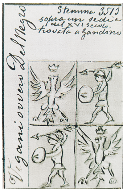
Fig. 9. Stemma Del Negro tratto da Cesare De' Gherardi Camozzi Vertova, Stemmi delle famiglie bergamasche e oriunde della provincia di Bergamo o ad essa per diverse ragioni attenenti , 1888.

opere mostrano un dettato compositivo e stilistico che porta a maturazione un linguaggio di più compiuta fusione atmosferica tra le figure e l'ambientazione naturalistica tramite dosati passaggi chiaroscurali oltre che una raffinata scrittura pittorica e una temperatura emotiva più addolcita. Come già evidenziato, la tela di Trescore recupera l'impianto della pala dell'altare di San Bernardino a Leffe perfino nell'effigie del predicatore francescano. Una scelta non casuale vista la provenienza dei committenti. Lo stemma posto in basso a destra (fig. 8), vicino all'elmo, già ritenuto dei nobili Terzi 42 , è invece quello dei Del Negro di Gandino 43 (fig. 9): un'arma inquartata con un'aqui-