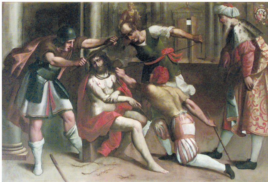
Fig. 2. Tomaso Pombioli, Incoronazione di spine , 1606, olio su tela, 125x185 cm, Leffe, San Rocco (Archivio fotografico della Diocesi di Bergamo).

con buona probabilità eseguite in diversi momenti. Se la Deposizione nel sepolcro spetta a un veneto tardo manierista gravitante nell'orbita dei cosiddetti pittori delle "Sette Maniere" 20 , le altre tre, raffiguranti l' Orazione nell'orto del Getsemani (fig. 1), l' Incoronazione di spine (fig. 2) e Cristo inchiodato alla Croce (fig. 3) sono da accostare all'artista cremasco e recano lo stemma della famiglia Gallizioli: sul Cristo inchiodato in particolare, accanto all'emblema figurano le iniziali del committente, S.G., che si potrebbero sciogliere in Santo Gallizioli 21 , e la data 1606 (fig. 4). Il