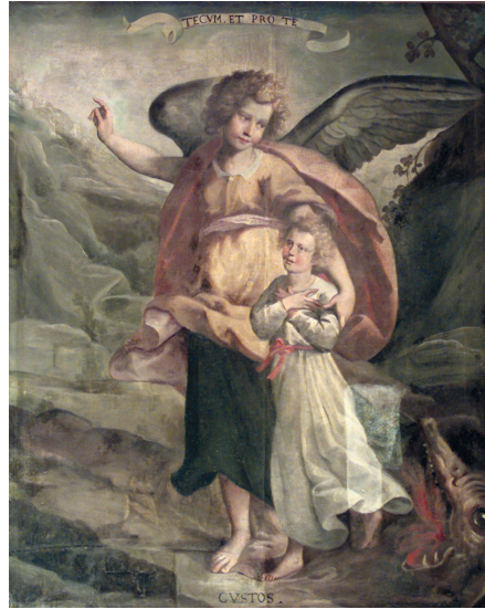
Fig. 5. Tomaso Pombioli, Angelo custode , 1626 circa, olio su tela, 126x107, cm, Leffe, Palazzo Galizzi, canonica (Archivio fotografico della Diocesi di Bergamo).

Ancora a Leffe, in Palazzo Galizzi, sede della casa canonica, si custodisce una tela con l' Angelo custode (fig. 5), già nella sagrestia della chiesa di San Michele e forse parte dell'arredo dell'antica parrocchiale. Il dipinto, poco considerato dalla storiografia locale 26 , è attribuibile al Pombioli per analogie con quello di medesimo soggetto degli Istituti di Ricovero di Crema 27 . Da qui riprende, pur con qualche variante, il cartone dell'Angelo in atto di abbracciare il fanciullo (si noti la sostanziale sovrapposizione nella postura della mano sinistra e l'andamento vaporoso del panneggio intorno alle ali) e la creatura mostruosa in basso a destra. Ciò che differisce invece è la figura del bambino, qui con la braccia conserte al petto e che pare essere tratta dall'incisione dei Doveri dell'Angelo custode di Hieronymus Wierix databile entro il 1619 28 . Anche il