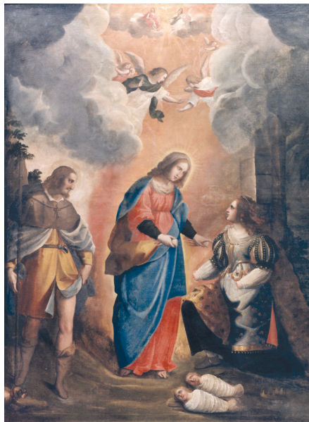
Fig. 7. Tomaso Pombioli, Madonna e i santi Rocco e Liberata , 1635 circa, olio su tela, 210x165 cm, Barzizza di Gandino, San Rocco (Archivio fotografico della Diocesi di Bergamo).

bile ai primi anni Trenta del Seicento. Le figure sono serrate intorno al Crocefisso (stringenti affinità lo accomunano al quello di Leffe), quasi senza separazione con il Cristo, in una bilanciata compostezza che si esprime tramite la ricerca di rigorosi rapporti lineari tra di esse: i loro atteggiamenti sono volti alla contemplazione e i gesti appena accennati. Anche la tavolozza si attenua per adeguarsi a questo clima sospeso ed evita di ricorrere a tinte accese.